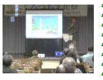
立石校区史跡講話