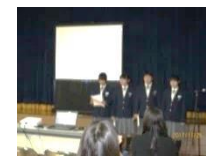
中学生のブラックパネルシアター